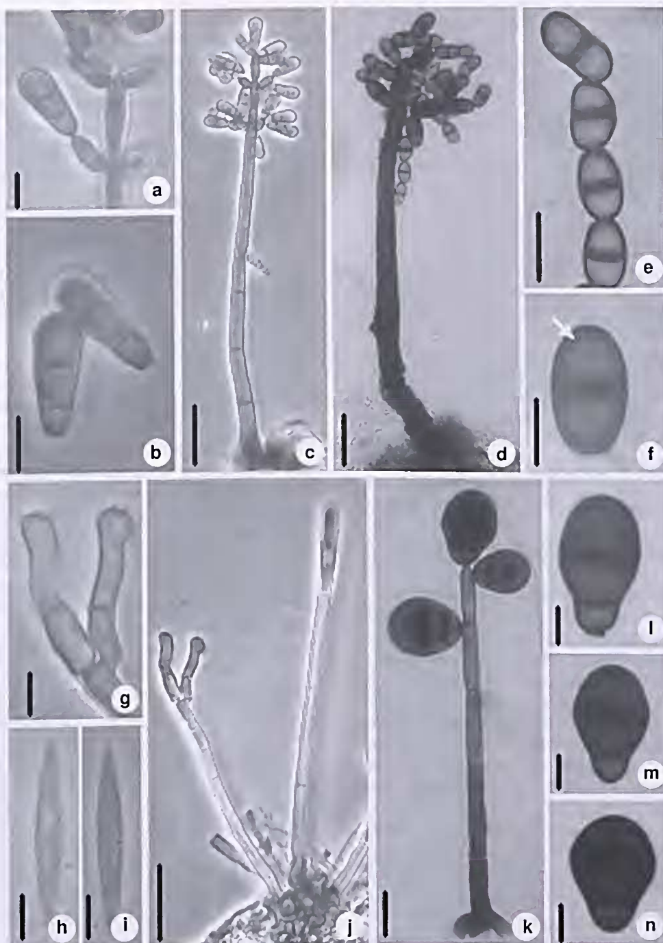
Figura 1 – a-c. Dendryphiosphaera parvula Nawawi & Kuthub. – a. ápice do conidióforo com células conidiogênicas e conídio; b. conídios; c. aspecto geral. d-f. Diplococcium dendrocalami Goh, K.D. Hyde & Umali – d. aspecto geral; e. conídios em cadeia; f. conídio com poro em destaque (seta). g-j. Hemibeltrania decorosa R.F. Castañeda & W.B. Kendr. – g. células conidiogênicas; h-i. conídios; j. conidióforo e seta. k-n. Spadicoides macroobovata Matsush. – k. aspecto geral; l-n. Conídios. Barras: 20 \mu m (c-d, j); 10 \mu m (e, k); 5 \mu m (b, a, f, g-i, l-n).

Figure 1 – a-c. Dendryphiosphaera parvula Nawawi & Kuthub. – a. apex of conidiophore with conidiogenous cells and conidium; b. conidia; c. general aspect. d-f. Diplococcium dendrocalami Goh, K.D. Hyde & Umali – d. general aspect; e. chains of conidia; f. conidium with pore detail (arrow). g-j. Hemibeltrania decorosa R.F. Castañeda & W.B. Kendr. – g. conidiogenous cells; h-i. conidia; j. conidiophore and seta. k-n. Spadicoides macroobovata Matsush. – k. general aspect; l-n. conidia. Bars: 20 \mu m (c-d, j); 10 \mu m (e, k); 5 \mu m (b, a, f, g-i, l-n).